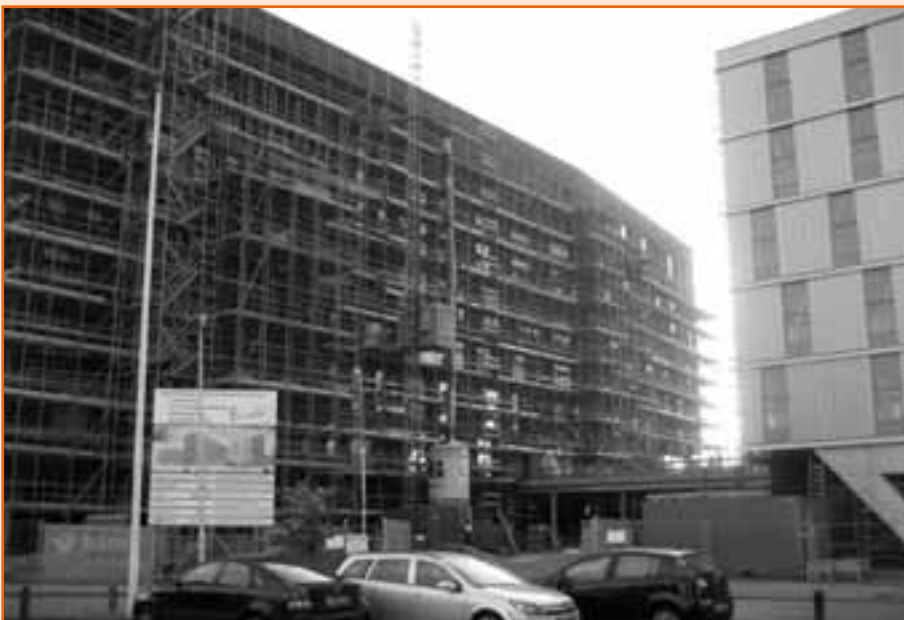
Het zorggebouw (bouwdeel B) nog in de steigers.