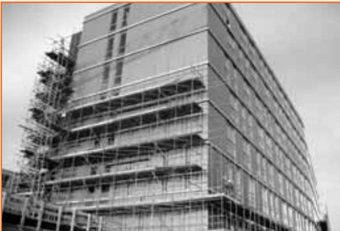
Het gebouw wordt zichtbaar bij het demonteren van de gevelsteigers