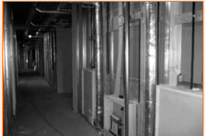
Montage van de binnenwanden en installaties op de verdiepingen.