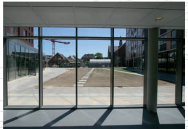
Restaurant 119 zitplaatsen