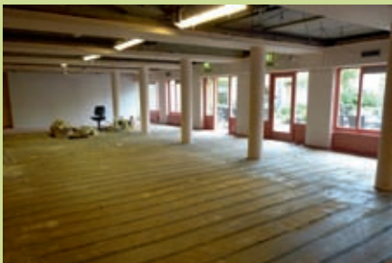
de Bijenkorf, zonder vloerbedekking

Op 4 juni was de oplevering van de locatiekeuken. Het schilderen van de Bijenkorf en front- en backoffice is ook afgerond. Aan een nieuw plafond, verlichting en vloerbedekking in de Bijenkorf wordt nog gewerkt. Na de bouwvakantie wordt gestart met het schilderen van de buitenkant. Een fietsenstalling en rookruimte zijn ook gerealiseerd.